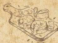
PLANCHE MIXTE ASSORTIMENT DE FROMAGES ET CHARCUTERIES

LA FROMETONNE ASSORTIMENT DE FROMAGES À LA COUPE